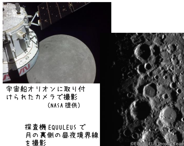
宇宙船オリオンに取り付けられたカメラで撮影

今後の計画は、2024年に宇宙飛行士を乗せて月を周回する試験飛行を行い、2025年には宇宙飛行士が月面へ降り立つ計画になっています。また、月の周辺に建設される新たな宇宙ステーション「ゲートウェイ」での活動に、日本人宇宙飛行士が1名参加することも決まっています。