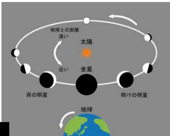
図1. 地球と金星の位置関係と金星の見え方

金星は、私たちの地球と同じく太陽の周りをまわる惑星の一つ。地球の内側で太陽の周りをまわっているため、地球からはいつも太陽の近くに見えます。そのため、真夜中には見えず、明け方の太陽が出てくる前や夕方の太陽がしずんだ後の限られた時間にしか見ることはできません。これを区別して、明け方の東の空に見えるときを“明けの明星”，夕方の西の空に見えるときを“宵の明星”と呼んでいます。