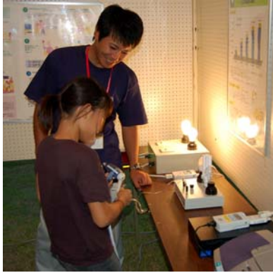
天文台 & 環境ブースの体験コーナー

イベントでは、ライトダウンや環境・光害に関するお話、そして当日見える星空の紹介のあと、プロのミュージシャンによる星空ライブを開催しました。また天文台と環境に関するブースも設置され、たくさんの方が興味津々でのぞいてくださいました。