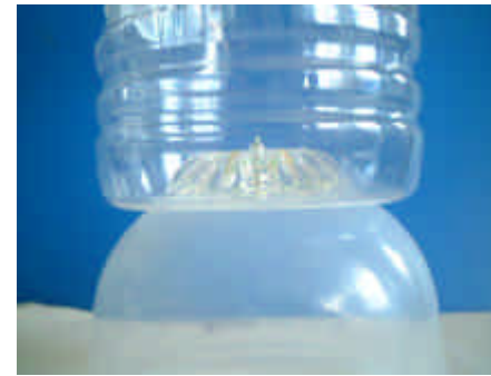
図 4-1 横から見たところ