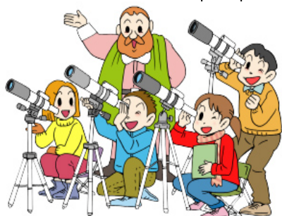
イラスト/藤井龍二